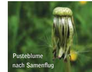
Pustelblume nach Samenflug